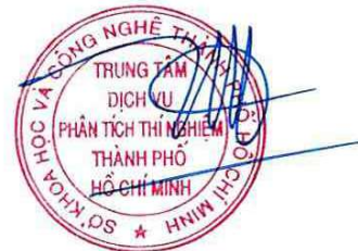
Nguyễn Quốc Hùng

1/ KẾT QUẢ NÀY CHỈ CÓ GIÁ TRỊ TRÊN MẪU THỬ/ THIS RESULT IS ONLY VALID ON TESTED SAMPLE. 2/ Thông tin về mẫu được ghi theo yêu cầu của khách hàng/ The sample information is written as customer's request. 3/ Không được sao chép toàn bộ hoặc một phần kết quả này dưới bất kỳ hình thức nào nếu không được sự đồng ý bằng văn bản của CASE/ No fully or partial of this result may be reproduced in any form without prior permission in writing from CASE.